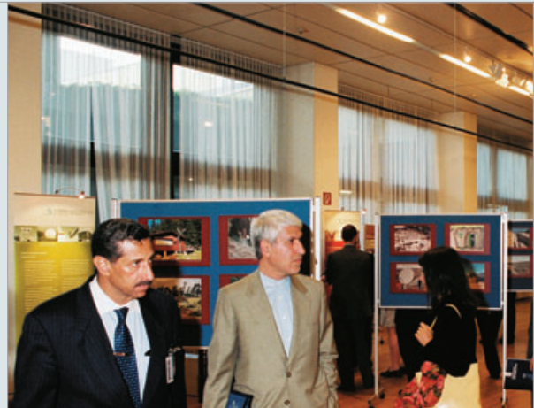
"معاهدة الحظر الشامل للتجارب النووية: نظام التحقق العالمي"، المعرض الذي نظّمته الأمانة الفنية المؤقتة في مؤتمر المادة الرابعة عشرة.