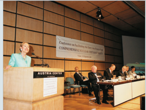
معالي السيدة نيتا فيريرو-فالدنر، وزيرة الشؤون الخارجية الاتحادية في النمسا، تلقي كلمة ترحيبية في مؤتمر المادة الرابعة عشرة نيابة عن البلد المستضيف.