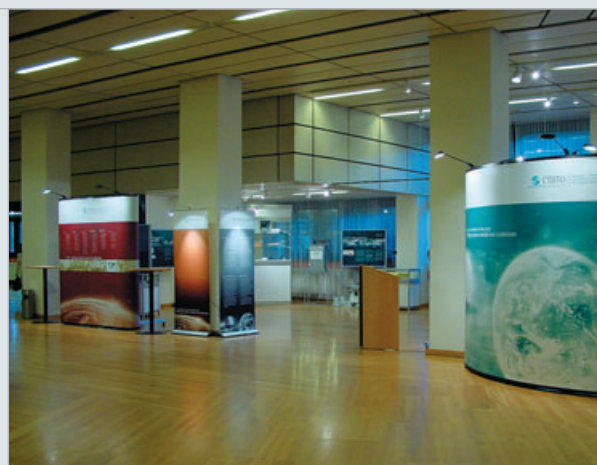
“El TPCE: un régimen de verificación mundial”, exposición de la STP durante la conferencia prevista en el artículo XIV.