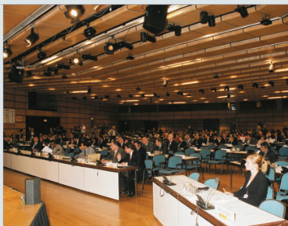
La Excelentísima Señora Benita Ferrero-Waldner, Ministra Federal de Relaciones Exteriores de Austria, durante su discurso de bienvenida en nombre del país anfitrión a los participantes en la conferencia prevista en el artículo XIV.