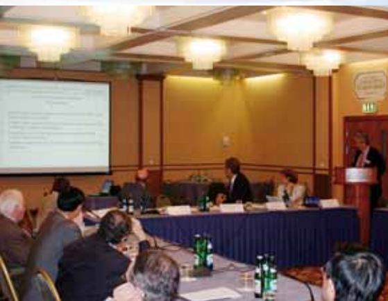
下图：2006 年 9 月在布达佩斯举办的全面禁止条约核查技术用于民用和科学用途专家会议的参加者。