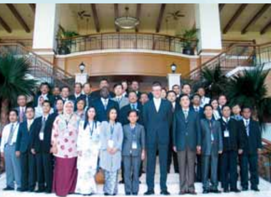
上图：2006 年 5 月至 6 月在吉隆坡举办的国际合作讲习班的参加者。

在匈牙利政府提供的财政支助支持下，在布达佩斯举行了一次专家会议（2006 年 9 月 2 日至 3 日），来自 28 个国家的 40 多名专家出席了会议。此次会议在伦敦（2002 年）、萧普朗（2003 年）和柏林（2004 年）专家讨论会的结论基础上，审查和探讨了核查技术用于民用和科学用途可能产生的新效益。因此，会议还讨论了临时秘书处对海啸预警中心的支助问题、地震声学 and 放射性核素监测技术，国家数据中心工作人员的能力建设以及临时秘书处与国家机构之间的合作。关于在线教育的会议突出了终端用户的需要，并讨论了能否将训练模块纳入在线教育项目。另一方面，会议强调，