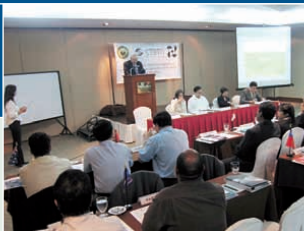
Curso práctico sobre cooperación internacional realizado en Manila (Filipinas) en junio de 2007.

En 2007 la STP dedicó sus cursos prácticos a los Estados de las regiones de Asia sudoriental, el Pacífico y el Lejano Oriente y América Latina y el Caribe. Para los cursos realizados en junio y noviembre, se habían fijado respectivamente los objetivos siguientes: a) profundizar la comprensión del TPCE, la labor de la Comisión y las tecnologías del régimen de verificación del Tratado; b) promover el establecimiento del régimen de verificación en la región; c) promover la entrada en vigor del Tratado; d) examinar los posibles beneficios de aplicar las tecnologías de verificación del Tratado con fines civiles y científicos; y d) estudiar y determinar diversos medios y mecanismos para promover la cooperación relativa al Tratado entre Estados vecinos.