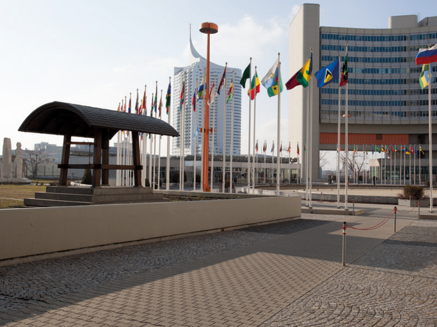
Венский международный центр – местопребывание Комиссии