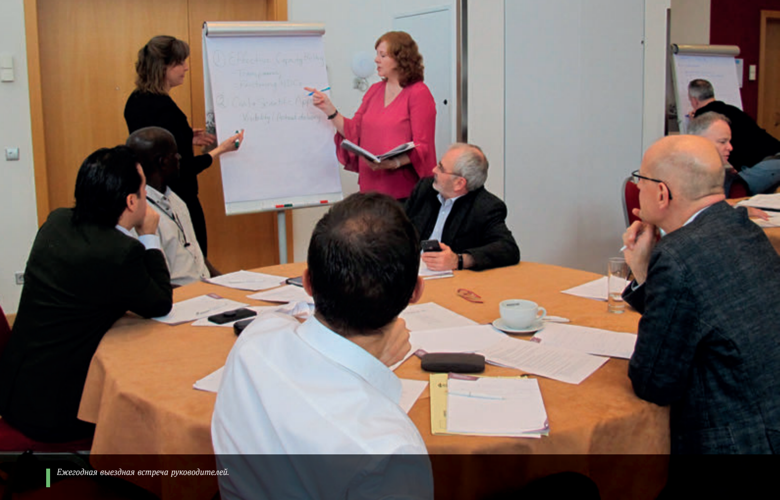
Ежегодная выездная встреча руководителей.