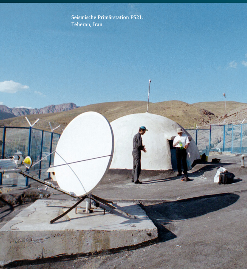
Seismische Primärstation PS21, Teheran, Iran