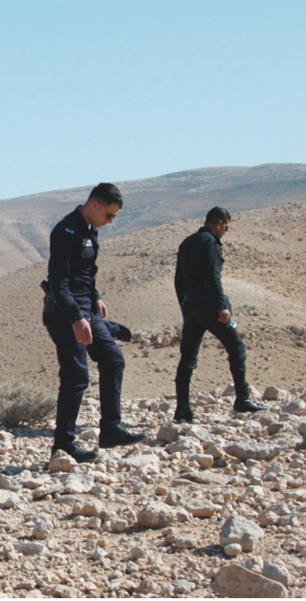
Regionaler CTBTO Vor-Ort-Inspektion-Schulungskurs in Kapstadt, Südafrika mit Teilnehmern aus 33 afrikanischen Ländern