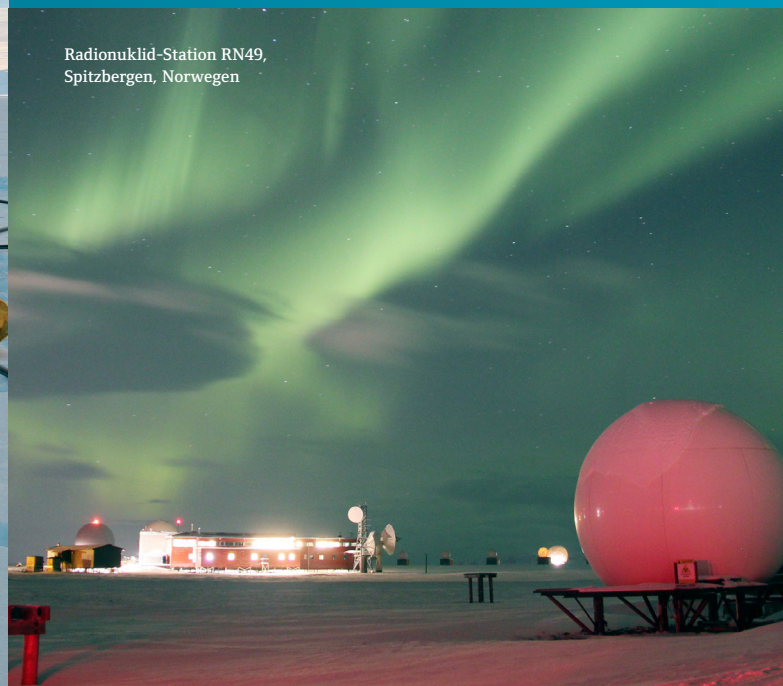
Radionuklid-Station RN49, Spitzbergen, Norwegen

Das Radionuklid-Netzwerk besteht aus 80 Stationen zur Erfassung radioaktiver Partikel, die durch atmosphärische Kernexplosionen freigesetzt werden bzw. bei oberflächennahen unterirdischen oder Unterwasserexplosionen entweichen. Die Hälfte dieser Stationen wird auch in der Lage sein, radioaktives Xenon zu detektieren, ein Edelgas, das ein Nebenprodukt von Nuklearexplosionen ist und nach einer unterirdischen Explosion in die Atmosphäre gelangen kann. Das Vorhandensein bestimmter Radionuklidpartikel und Edelgase sowie ihre relative Isotopenhäufigkeit ermöglichen es, die Quelle einer Emission, z. B. eine zivile Anwendung oder eine Kernexplosion, zu identifizieren. Die Radionuklid-Technologie bringt daher letztlich Klarheit, ob eine Kernexplosion stattgefunden hat oder nicht. Die 16 Radionuklid-Labors unterstützen das Netzwerk durch zusätzliche Analysen von Proben mit Radionukliden die möglicherweise durch eine Kernexplosion entstanden sind.